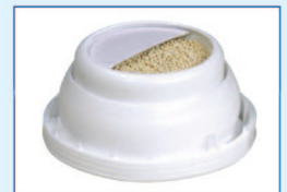
特殊的瓶蓋設計可保持瓶內乾燥