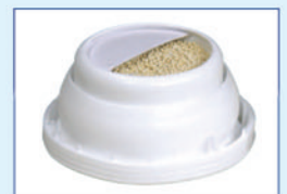
特殊的瓶蓋設計可保持瓶內乾燥